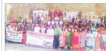
कांगाड़ा भूकंप की जयंति पर निकाली गई जागरूकता रैली।