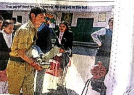
धणाहटी स्कूल में मॉकड्रिल में बचाव कार्य करते स्टूडेंट्स।