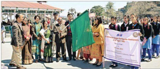
शिमला के रिज मैदान पर आपदा प्रबंधन पर आयोजित जागरूकता रैली को हरी झंडी दिखाते जिला निर्वाचन अधिकारी।