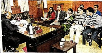
दिव्यांगों को लेकर आयोजित बैठक में मौजूद डीसी और अन्य अधिकारी।