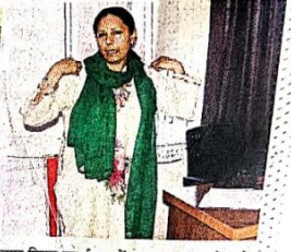
नगर निगम कार्यालय में आपदा प्रबंधन के बारे में कर्मचारियों को जानकारी देते अधिकारी।